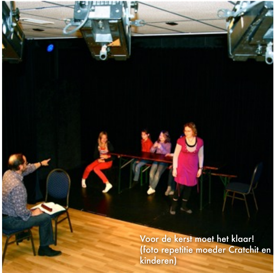
Voor de kerst moet het klaar! (foto repetitie moeder Cratchit en kinderen)